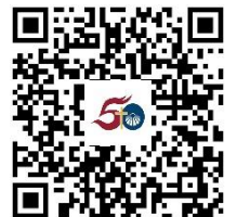
聯合金禧紀錄片 (第三集)

連結： https://www.methodist.org.hk/union50/documentary3